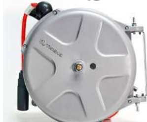
รหัสสินค้า FTSHM-313