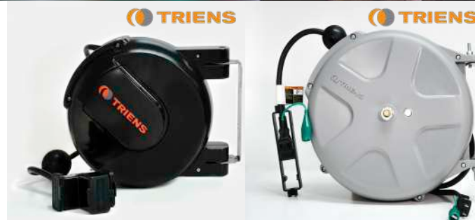
รหัสสินค้า FTWCC-306A