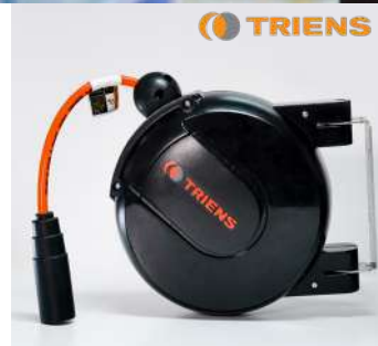
รหัสสินค้า FTWHC-206A*