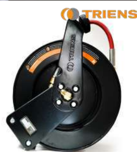
รหัสสินค้า FTGM1A-330