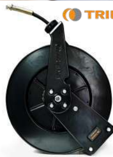
รหัสสินค้า FTGS1A-410