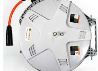
รหัสสินค้า FTSHR35Z