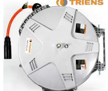
รหัสสินค้า FTSHR-20Z