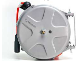
รหัสสินค้า FTSHS-310A