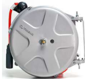
รหัสสินค้า FTSHM-215