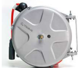
รหัสสินค้า FTSHS-210Z