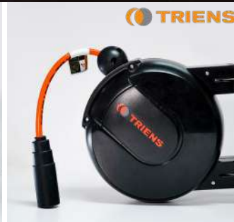
รหัสสินค้า FTWHC-303A