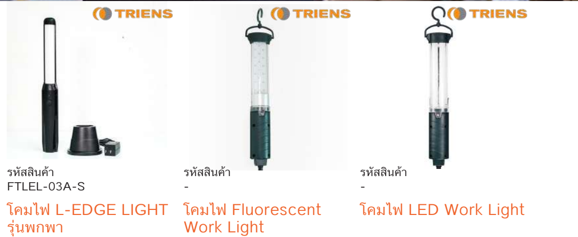
รหัสสินค้า FTLEL-03A-S