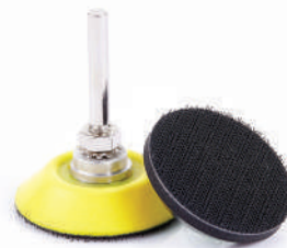
รหัสสินค้า FMPADF3016