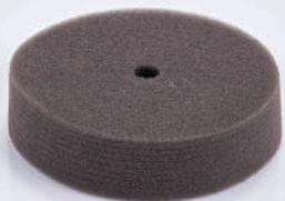
รหัสสินค้า FU5512

ขนาด 80 มิลลิเมตร วัสดุ ยูรีเทน ความหนา 20 มิลลิเมตร หลัง สลักะหลาด