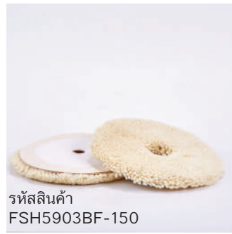
รหัสสินค้า FSH5903BF-150