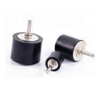
รหัสสินค้า F-MPADRD034