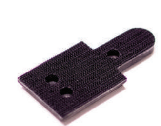
รหัสสินค้า F-UPAD7021