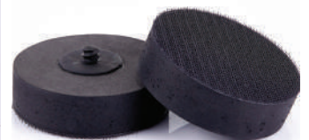
รหัสสินค้า F-MPADES3013-20

ขนาด 50 มิลลิเมตร วัสดุ ขนแกะ ความหนา 5 มิลลิเมตร หลัง สลักะหลาด