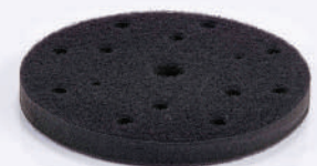
รหัสสินค้า FMPAD5.31615

แป้น Soft ขนาด 6" x 15 รู ความหนา 10 มิลลิเมตร หลัง สลักะหลาด