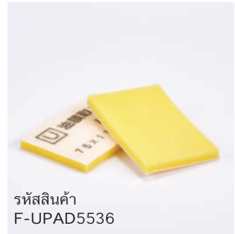
รหัสสินค้า F-UPAD5536