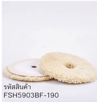
รหัสสินค้า FSH5903BF-190