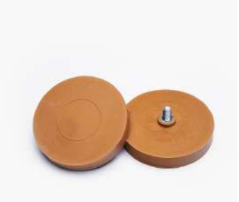
รหัสสินค้า FSP-MST260-35