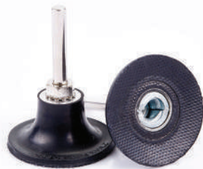
รหัสสินค้า FLSH-50/25/6

เหมาะกับเครื่องรุ่น : 161A,161AT,161B,161BT,161C,161CT,U-1625,U1625R