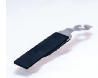
รหัสสินค้า F-UPAD777