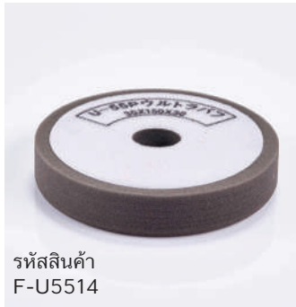
รหัสสินค้า F-U5514