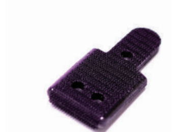
รหัสสินค้า F-UPAD7020