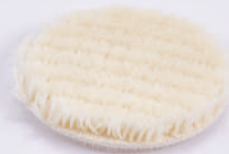
รหัสสินค้า FSH5513-50

ขนาด 80 มิลลิเมตร วัสดุ ขนแกะ ความหนา 10 มิลลิเมตร หลัง สลักะหลาด