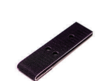
รหัสสินค้า F-UPAD5539