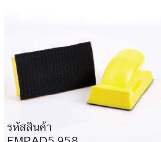
รหัสสินค้า FMPAD5.958