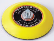
รหัสสินค้า FMPAD5.1308TR9MM