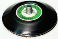
รหัสสินค้า FSPU83P-41

ขนาด 3" ขนาดเกลียว 9 มม ความหนา 10 มิลลิเมตร หลัง สลักะหลาด