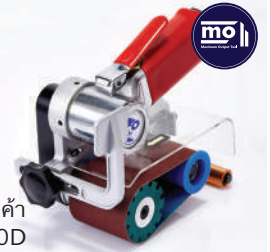
รหัสสินค้า FM770D