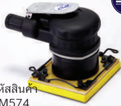
รหัสสินค้า FM574