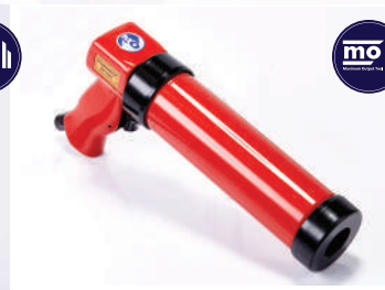
รหัสสินค้า FMPT203