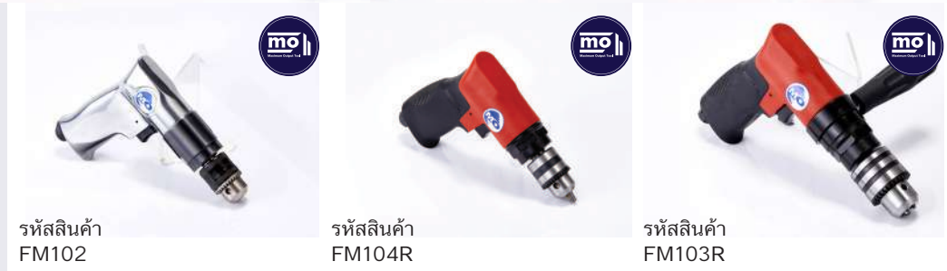
รหัสสินค้า FM102