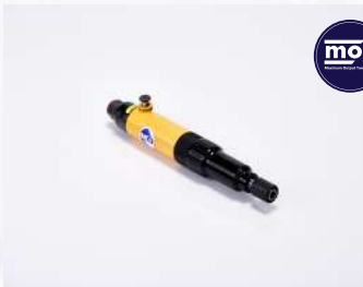
รหัสสินค้า FM304