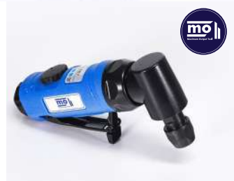
รหัสสินค้า FM161AT