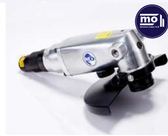
รหัสสินค้า FM871