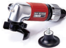
รหัสสินค้า FU102GR