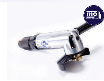
รหัสสินค้า FM842