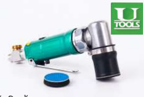
รหัสสินค้า FU51SV