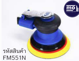
รหัสสินค้า FM551N