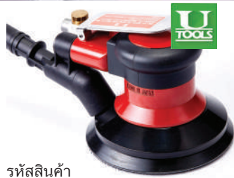
รหัสสินค้า FU55D