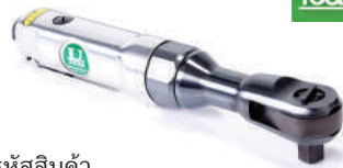
รatchet wrench FU131