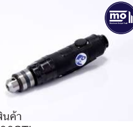
รหัสสินค้า FM100STL