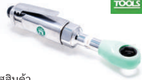
รatchet wrench FU220