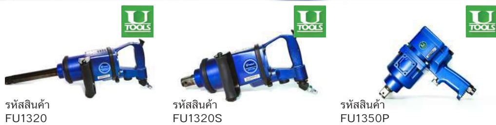
รหัสสินค้า FU1320