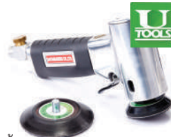
รหัสสินค้า FU52