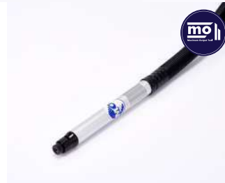
รหัสสินค้า FM131C