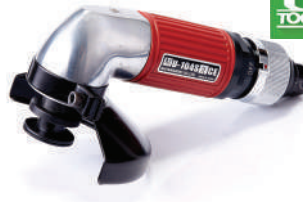
รหัสสินค้า FU104SR