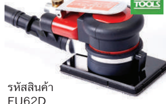
รหัสสินค้า FU62D