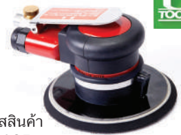
รหัสสินค้า FU625