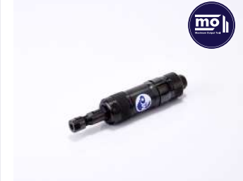
รหัสสินค้า FM161P