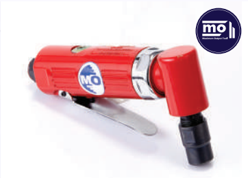
รหัสสินค้า FM161CT