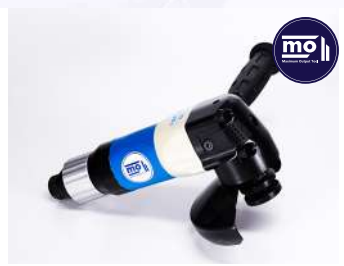
รหัสสินค้า FM843