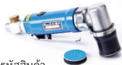
รหัสสินค้า FU51