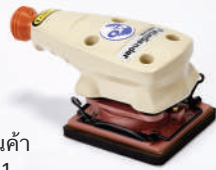
รหัสสินค้า FM571