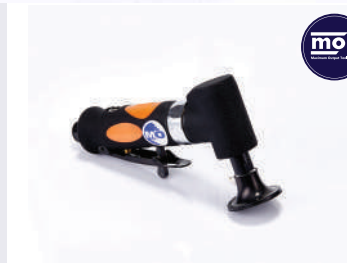
รหัสสินค้า FM161T