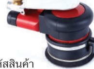
รหัสสินค้า FU623