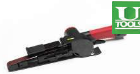
รหัสสินค้า FU120