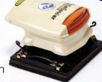
รหัสสินค้า FM572