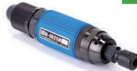
รหัสสินค้า FU1625R