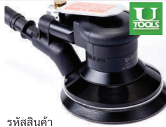
รหัสสินค้า FU55JD