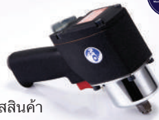
รหัสสินค้า FM64094