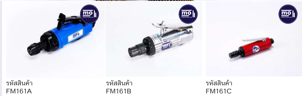
รหัสสินค้า FM161A