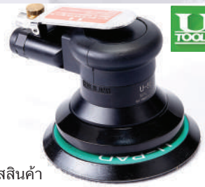
รหัสสินค้า FU55J