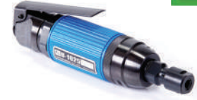
รหัสสินค้า FU1625