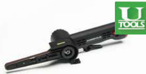
รหัสสินค้า FU110M