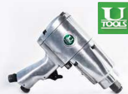
รหัสสินค้า FU156