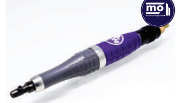
รหัสสินค้า FM201C