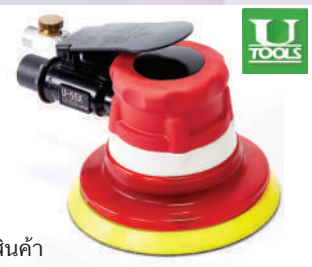
รหัสสินค้า FU55X