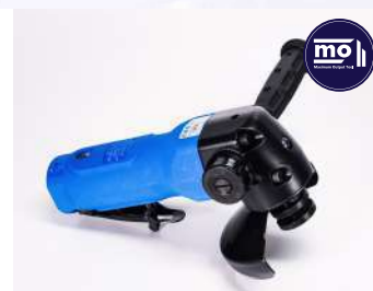
รหัสสินค้า FM841L