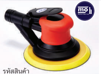
รหัสสินค้า 552S