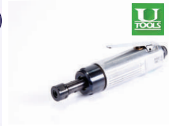
รหัสสินค้า FU130D