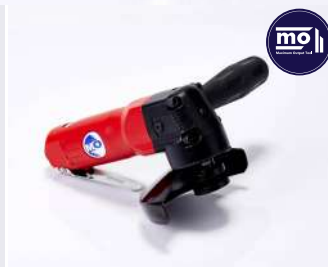
รหัสสินค้า FM844L