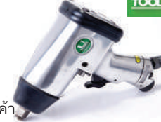
รหัสสินค้า FU845