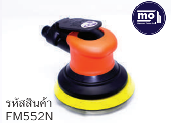
รหัสสินค้า FM552N