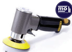
รหัสสินค้า FM181B