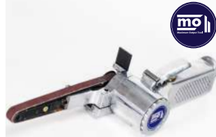
รหัสสินค้า FM770A