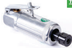
รหัสสินค้า FU130