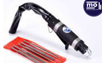
รหัสสินค้า FM201B