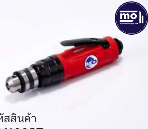
รหัสสินค้า FM100ST