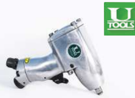
รหัสสินค้า FU135