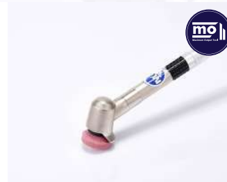
รหัสสินค้า FM131T