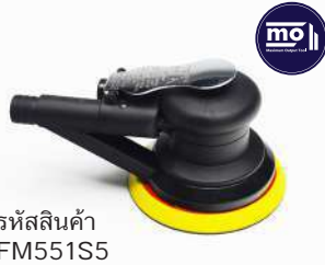
รหัสสินค้า FM551S5