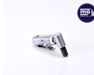
รหัสสินค้า FM161BT