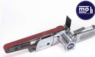
รหัสสินค้า FM770B