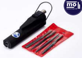
รหัสสินค้า FM201