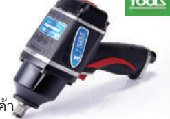
รหัสสินค้า FU170T