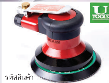
รหัสสินค้า FU55