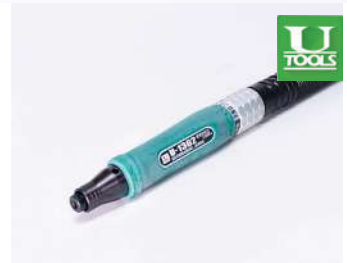
รหัสสินค้า FU1362