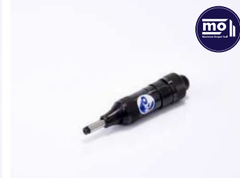
รหัสสินค้า FM131P