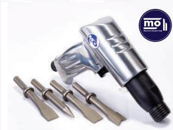
รหัสสินค้า FM302