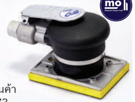
รหัสสินค้า FM573