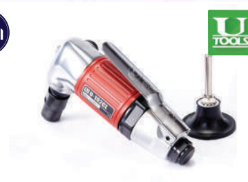
รหัสสินค้า FU102CL