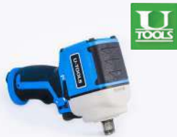
รหัสสินค้า FU150ST